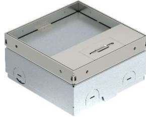
Tampa com reentrância para revestimento do pavimento

com duas versões de tampas diferentes que podem ser facilmente trocadas em qualquer altura.