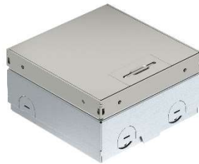
Tampa com placa decorativa