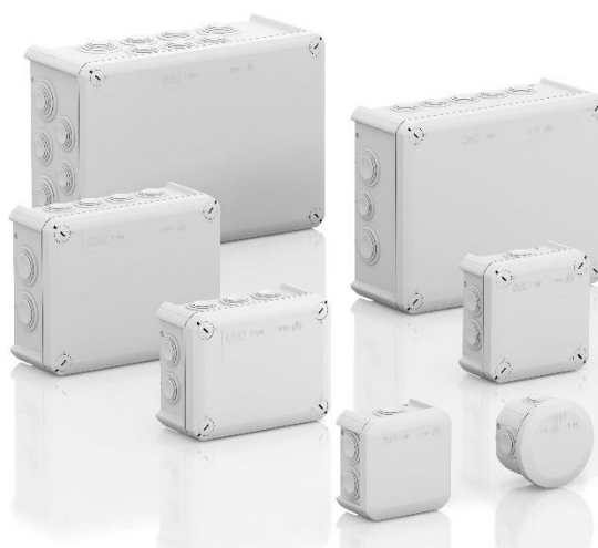
Caixas de derivação T-Box com buçins cónicos, cinza (cor cinzento claro)