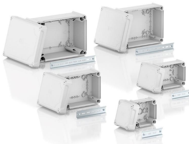
Caixas de derivação T-Box lisa com tampa alta opaca, cinza (cor cinzento claro)