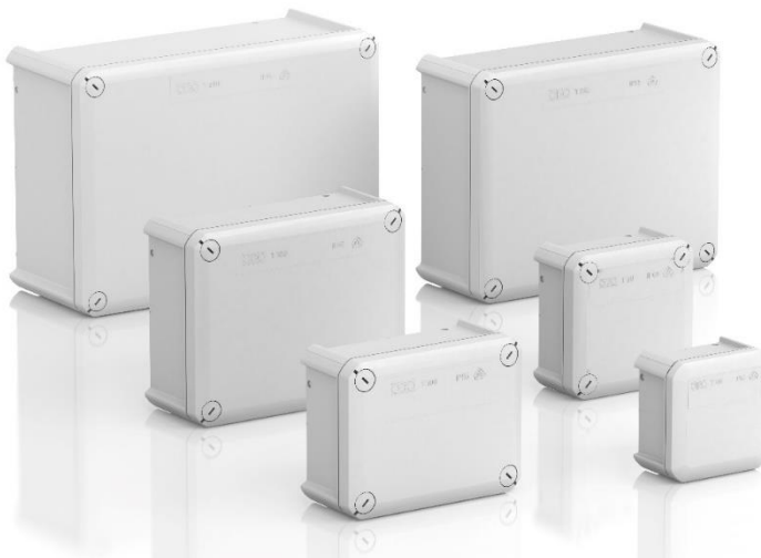
Caixas de derivação T-Box lisa, cinza (cor cinzento claro)